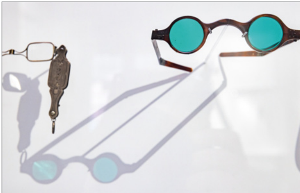
Schicke Brillen in der Dauerausstellung

Die Dauerausstellung in der „Alten Anatomie“ stellt die medizinische Welt des 18. Jahrhunderts vor und widmet sich 21 „Starken Dingen“ aus der Sammlung des Hauses. Bei der Führung werden ausgewählte Objekte und ihre Geschichte präsentiert.