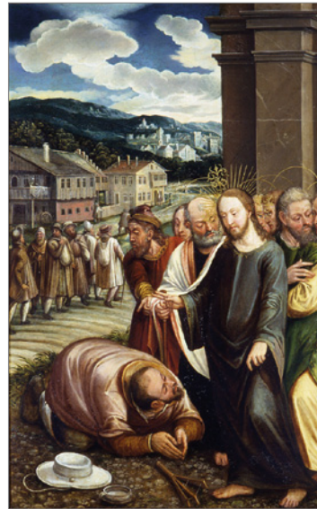
Christus heilt den Aussätzigen. Tafelgemälde von Hans Mielich (1572) am Hochaltar des Ingolstädter Münsters