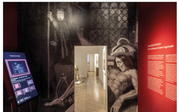
Die Geburt der Kreatur

Der bekannteste Medizinstudent der Universität Ingolstadt hat nie gelebt: Victor Frankenstein. Doch wenn es ihn gegeben hätte, dann wäre er hier, in der „Alten Anatomie“, am Seziertisch gestanden!