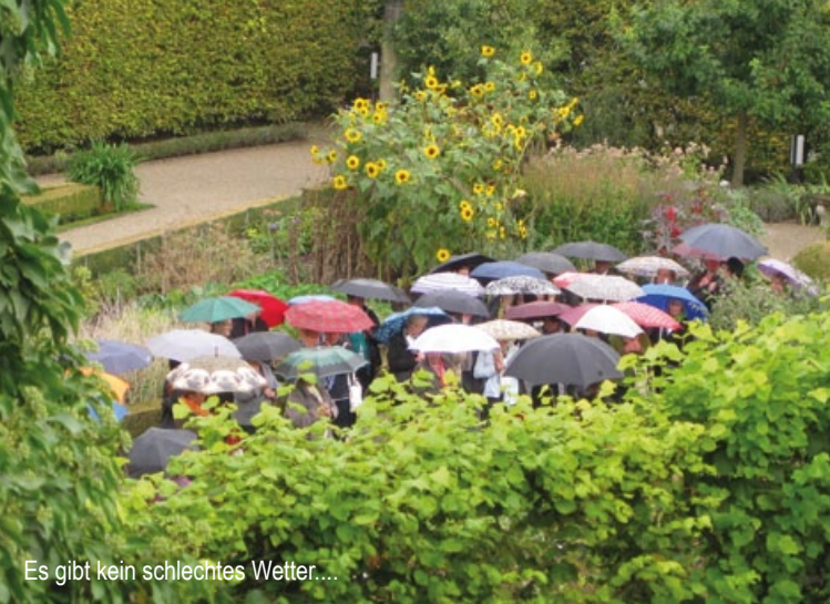
Es gibt kein schlechtes Wetter....