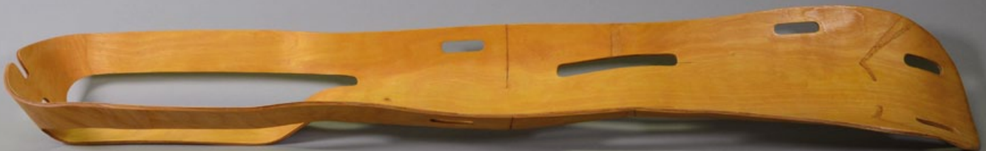
Beinschiene von Charles und Ray Eames, Entwurf 1943 (MKK)