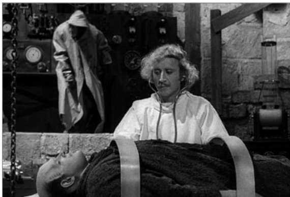
„Young Frankenstein“ 1974, Regie: Mel Brooks

Dauer ca. 60 min., Eintritt frei, keine Voranmeldung